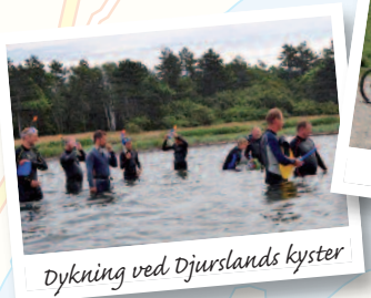
Dykning ved Djurslands kyster

Find information, henvisninger og adresser på vores hjemmeside.