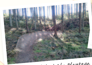
Mountainbike i Sdr. Plantage