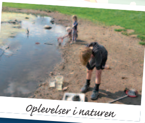
Oplevelser i naturen