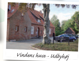
Vindens huse - Udbyhøj