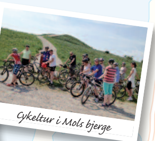
Cykeltur i Mols bjerger