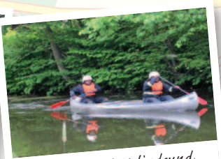
Kanotur på Kolindsund