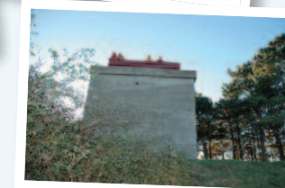
Tyskertårnet - Sletterhage